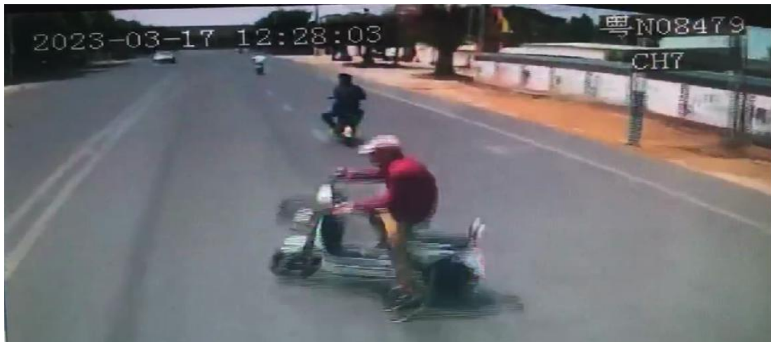
图 1-4 行车记录仪监控截图