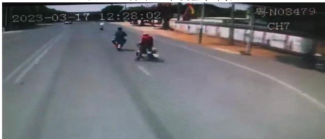
图 1-2 行车记录仪监控截图