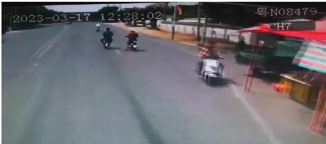
图 1-1 行车记录仪监控截图

2023年3月17日12时28分许，司机陈*军驾驶粤N08479号大型普通客车（核载58人，实载20人）沿碣南公路由东往西行驶，途经Y535碣上线时（碣石镇碣南大道石洲文化公园路口路段），右前方由郭*清驾驶的电动自行车（国标）突然变道并转弯，导致粤N08479号大型普通客车与电动自行车（国标）发生碰撞（图1-1至图1-4），造成郭*清倒地受伤。