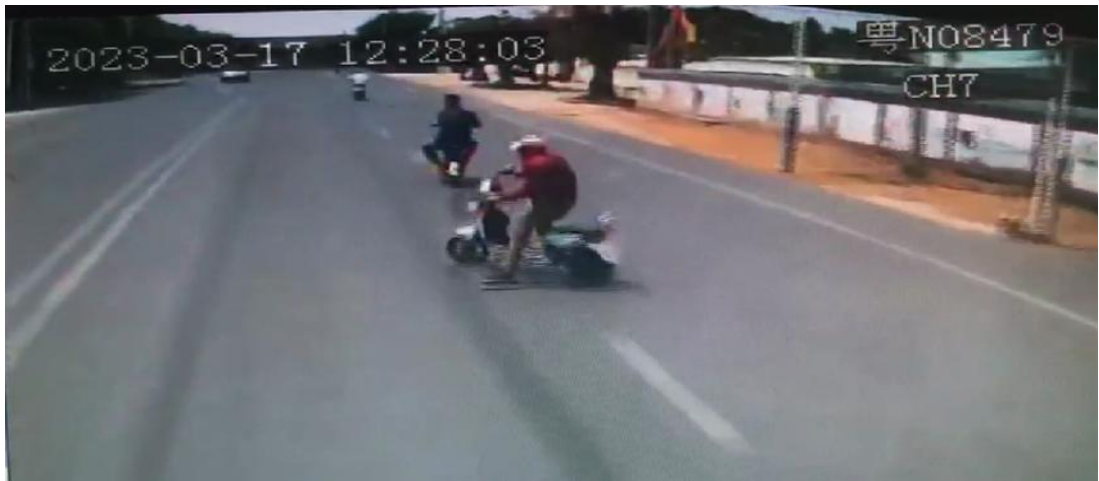
图 1-3 行车记录仪监控截图